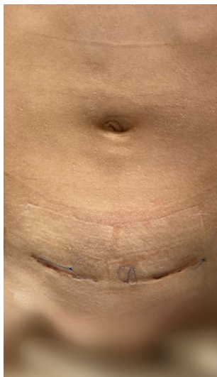
Bruško po klasickej operácii obojstrannej hernii

Zárok sa uskutočňuje v celkovej anestézii. Kožný rez sa vedie v oblasti pupka, najčastejšie na jeho dolnej 1/3 obvodu. Tento kožný rez sa dá schovať za kožnú riasu, ktorú tvorí pôvodná pupočná jazva. Pokiaľ má dieťa aj pupočný pruh, je možné a vhodné využiť vrodený defekt v pupku pre vstup kamery. Bruško sa nafúkne pomocou CO 2