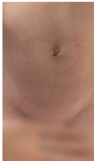
Bruško po operácii PIRS týždeň po