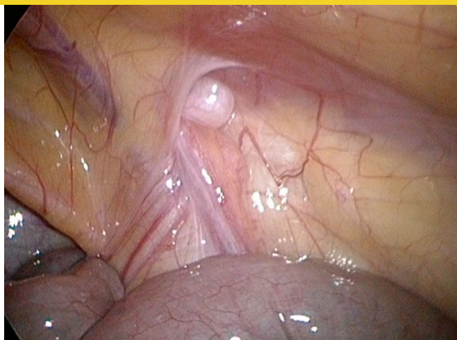
Laparoskopický pohľad z dutiny brušnej na nezostúpené vajíčko

Vždy je prvotnou snahou vajíčko zachrániť a dostať ho na svoje správne miesto. No najprv ho v tom brušku musíme pohľadať. A v tom nám najlepšie pomôže laparoskopia, pomocou ktorej môžeme prehliadať celú cestu zostupu vajíčka. Ak ho nájdeme, urobíme prvú dobu operácie a o pol až jeden rok druhú dobu zo slabinového prístupu (Fowler-Spehensova operácia).