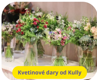
Kvetinové dary od Kully