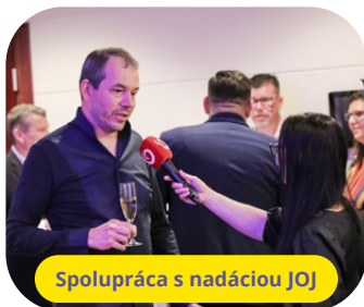
Spolupráca s nadáciou JOJ