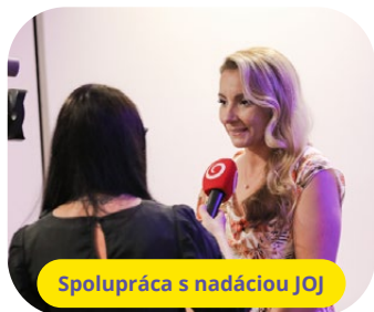
Spolupráca s nadáciou JOJ